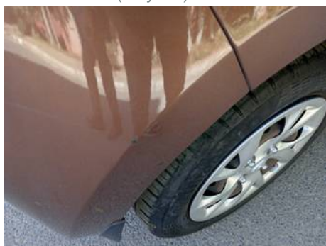
Bouclier arrière (Rayure)