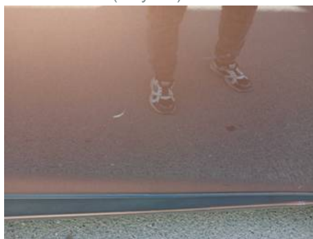
Porte avant droite (Rayure)